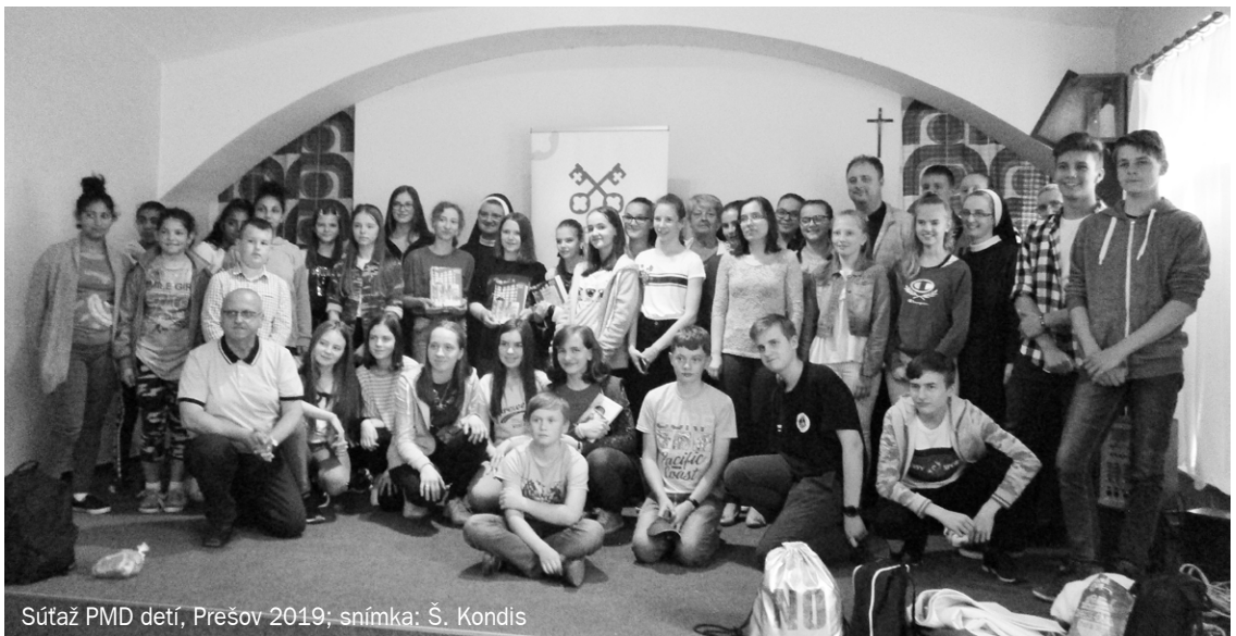
Súťaž PMD detí, Prešov 2019; snímka: Š. Kondis

Národná kancelária PMD v Bratislave roku 1997 pre mňa vydala Dekrét misijného horlitéla, ktorý ma oprávňoval stretávať sa s člen-