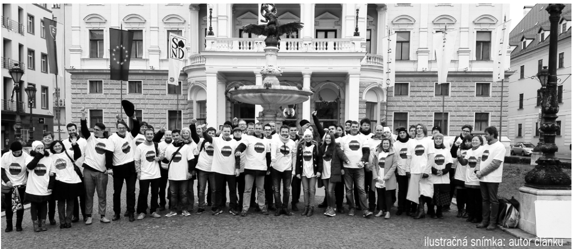
ilustračná snímka: autor článku