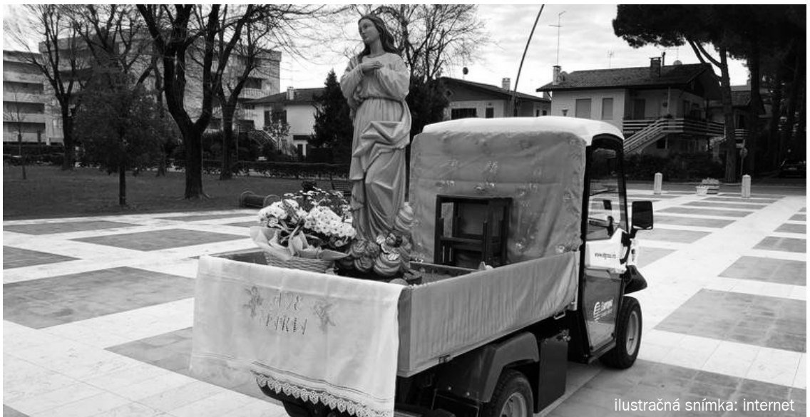
ilustračná snímka: internet

Don Andrea videl v očiach mnohých ľudí aj strach. „Najmä u starších ľudí. Dokonca aj na ulici som videl veľa znepokojených očí a sĺz, keď videli sochu Madony. Ľudia cítia závažnosť situácie.“