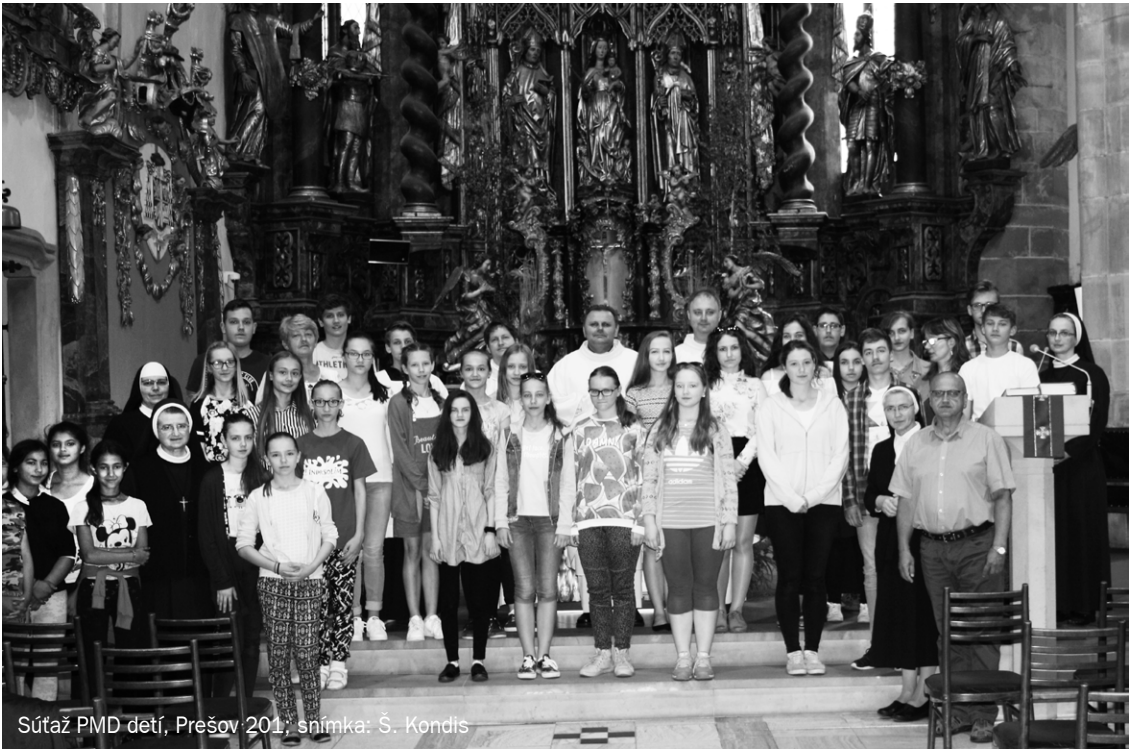
Súťaž PMD detí, Prešov 2011

Človek nie je robot a potrebuje niekedy aj vypnúť a relaxovať. Svoj voľný čas sa snažím venovať rodine. Spolu chodíme na prechádzky do prírody, na huby, zrúcaniny hradov, ktoré máme na východe Slovenska takmer všetky zdolané. Zúčastňujeme sa púťi na Mariánsku horu v Levoči, každoročne chodievame do Krakova-Lagiewnik na púť s rádiom Lumen. Vymýšľame a plánujeme spoločné dovolenky, venujem sa chovu anduliek a štvornohému rodinnému priateľovi, bežným údržbám a prácam okolo domu. Sem-tam niečo vytvorím ručnou prácou z dreva, kovu, čo spestrí a skrásli náš domov, alebo poteší ako darček pre známych a pod.