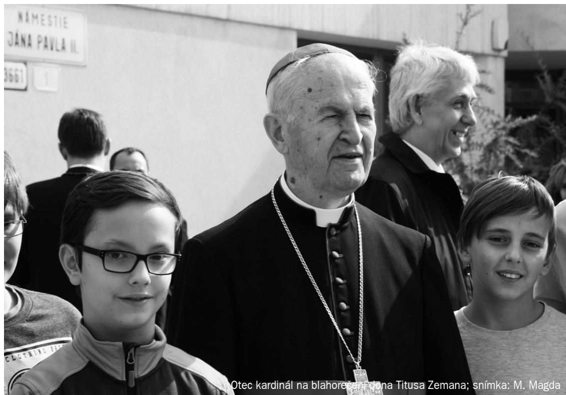
Otec kardinál na blahorečení dona Titusa Zemana

Dlhoročným zvykom slovenského kardinála je denný pohyb na čerstvom vzduchu.