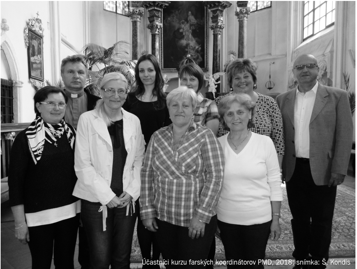
Účastníci kurzu farských koordinátorov PMD, 2018

tou v Košiciach sme v roku 2017 rozbehli projekt Farských koordinátorov PMD v Košickej arcidiecéze (FK PMD KE). Ponúkame veriacim spoluprácu s PMD Košickej arcidiecézy, kde z farnosti/filiálky môžu byť FK PMD KE najviac dvaja veriaci, ktorí dovŕšili vek 18 rokov. Títo dobrovoľníci pomáhajú ako diecéznemu riaditeľovi PMD KE a svojmu kňazovi, ktorého vopred informujú o pripravovanej misijnej aktivite a požiadajú ho o jeho súhlas a usmernenie, aby sa mohla vo farnosti zorganizovať napríklad v októbri modlitba Misijného ruženca a pripraviť výzdoba na slávenie Misijnej nedele. Šíria časopis PMD Svetové misie, ktorý vychádza dvakrát v roku zdarma. Neorganizujú žiadne finančné zbierky! V spolupráci s Teologickou fakultou v Košiciach absolvuje dobrovoľník jednoduchý