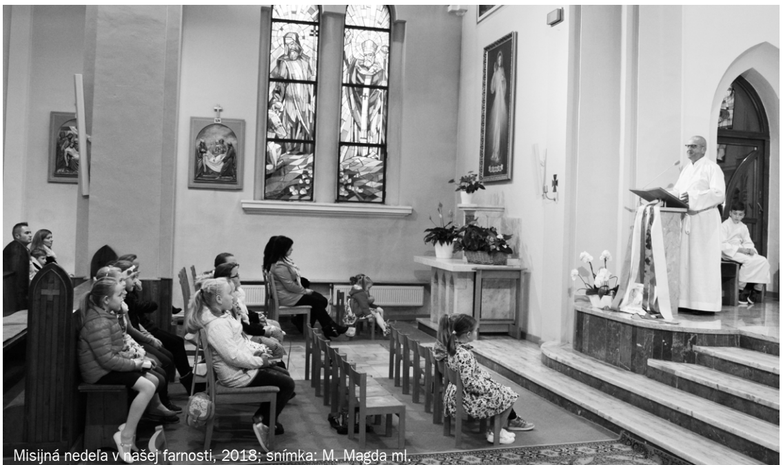
Misijná nedela v našej farnosti, 2018; snímka: M. Magda ml.

připravil: M. Magda a ☐ Kondis snímky: archív riaditeľa PMD