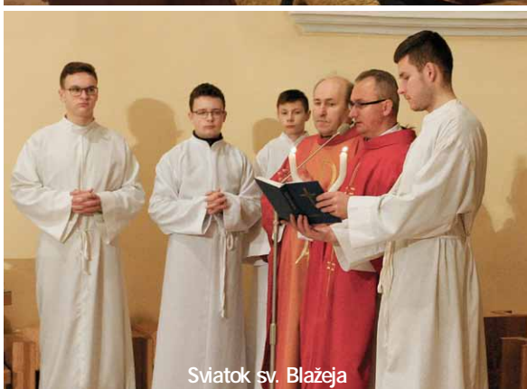
Sviatok sv. Blažeja