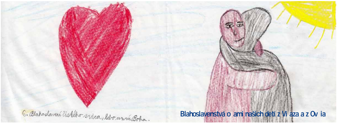
6. Blahoslavení čistého srdca, lebo mnú Boha.